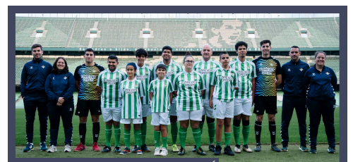
IMAGEN DEL REAL BETIS BALOMPIÉ El Real Betis ONCE es el actual campeón de la liga Fútbol 5.

Es en la ley 10/90 del 15 de octubre cuando desaparece la Federación Española de Deportes para Minusválidos y la progresiva constitución de cinco federaciones diferenciadas según la tipología de la discapacidad de las personas que practican deporte: intelectual, física, parálisis cerebral y daño cerebral adquirido, auditiva y visual. La ONCE en este marco ayuda a la creación de la Federación Española de Deportes para Ciegos (FEDC) que es reconocida por el Consejo Superior de Deportes e inscrita en el Registro de Entidades Deportivas el 27 de julio del 1993.