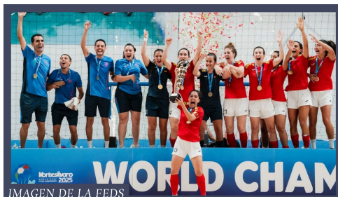
IMAGEN DE LA FEDS

Deben además estar federados en clubes de personas sordas. No están permitidos los audífonos ni implantes cocleares para asegurar igualdad en el juego.