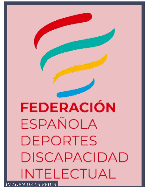
IMAGEN DE LA FEDDI

La Federación Española de Deportes para Personas con Discapacidad Intelectual fue fundada en 1995 y es la entidad española encargada de organizar, regular y promover la práctica deportiva entre personas con discapacidad intelectual. Impulsando competiciones nacionales e internacionales y dirigiendo a las selecciones españolas en estas categorías.