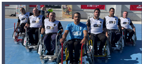
IMAGEN DE LA ASOCIACIÓN FUTBOLISTAS VCF

Por último, el partido consta de dos partes de veinte minutos y un tiempo muerto por parte. El resto de normas se rigen por el reglamento del fútbol sala.