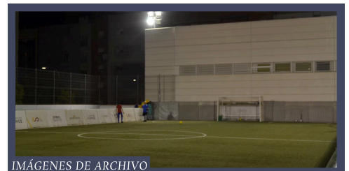
IMÁGENES DE ARCHIVO CENTRO LUIS BRAILLE, DONDE ENTRENA EL REAL BETIS ONCE

Cada equipo cuenta con tres guías diferentes. En primer lugar, el portero sirve como guía para la zona baja del campo, dando órdenes y orientando a los jugadores que se encuentren cerca de su propia portería. Por otro lado, el entrenador se ocupa de guiar a los jugadores que se encuentren próximos al medio del campo, tratando de organizar al equipo y las jugadas. Por último, un guía se sitúa detrás de la portería donde debe anotar el equipo para guiar a los jugadores en el último tercio del campo. Por ejemplo, en un lanzamiento de penalti, el jugador coloca el balón con ayuda del árbitro y el guía coloca al jugador, para después dirigirse a portería y hacer sonar los palos para que el jugador ubique la misma.