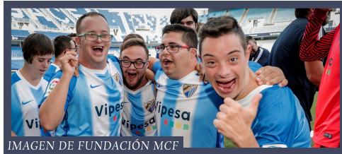
IMAGEN DE FUNDACIÓN MCF FUTBOLISTAS CON DISCAPACIDAD INTELECTUAL DEL MÁLAGA

Las personas que participan son aquellos deportistas que poseen discapacidad intelectual. Deben estar registrados y con licencia en FEDDI. Hay distintas categorías según edad y nivel. Hay clubes y federaciones territoriales que compiten y organizan las selecciones autonómicas. Por último, también participan técnicos, árbitros y delegados formados e inscritos en FEDDI.