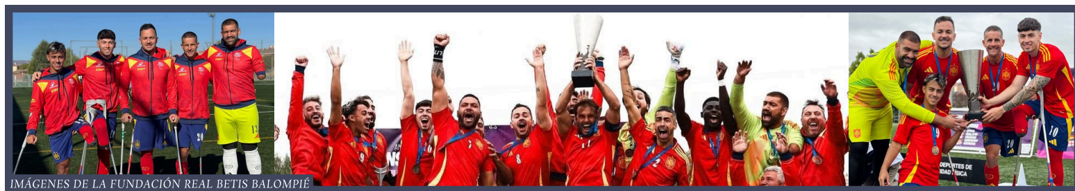
JUGADORES DEL REAL BETIS SELECCIONADOS Y LA SELECCIÓN ESPAÑOLA DE FÚTBOL PARA AMPUTADOS, GANADORES DE LA LIGA DE NACIONES B 2025

La FIFA ha llegado a un acuerdo con la Federación Mundial de Fútbol para Amputados para colaborar los próximos años en una serie de proyectos e iniciativas que fomenten el progresivo crecimiento y desarrollo de la modalidad en todo el mundo. Esto se enmarca en los objetivos estratégicos para el fútbol mundial: 2023-2027 de la FIFA y está vinculada con el compromiso de su presidente, Gianni Infantino, para apoyar a los futbolistas con amputaciones.