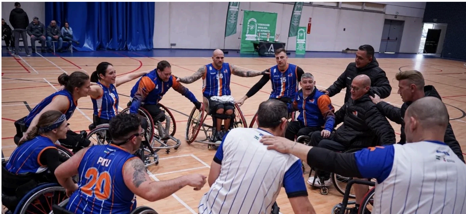
Fotografía del equipo antes de comenzar el partido

Francisco no pide privilegios, pide igualdad y equilibrio "Que el lugar donde se nace no condicione tanto las posibilidades de